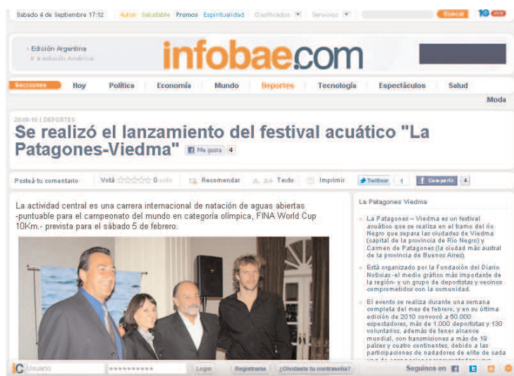
Infobae dio un tratamiento especial a la ceremonia realizada en el Panamericano.

La presentación celebrada en Buenos Aires tuvo una amplia repercusión en numerosos diarios y sitios especializados en deportes y turismo. La carrera, incluida en la World Cup de la Federación Internacional de Natación se llevará a cabo el sábado 5 de febrero de 2011.