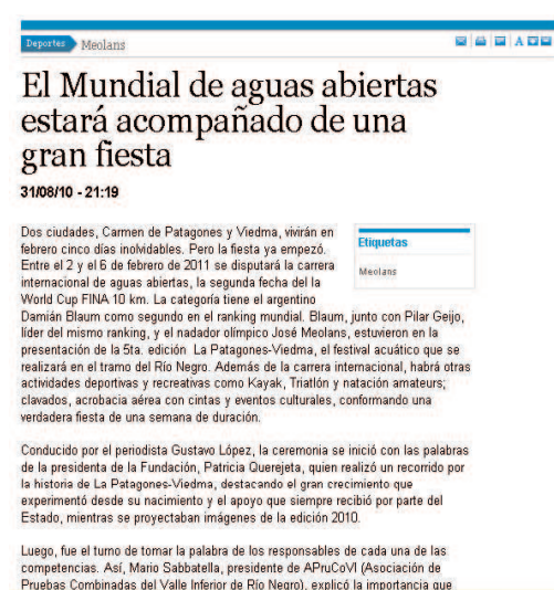
Clarín informó rápidamente en su portal on line.

Triamax, con foto de Guiscardo, Querejeta, Piit y Meolans.